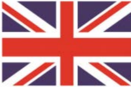
The United Kingdom